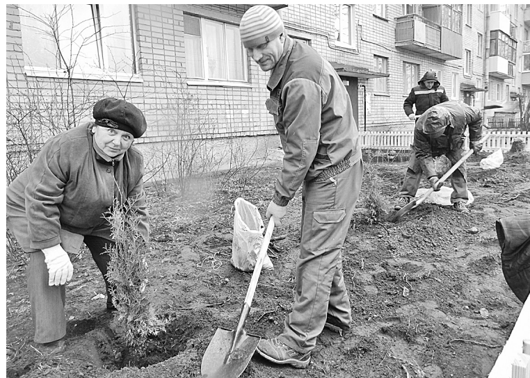
Без труда нет плода

Работники управляющей компании ООО «УК СЭИС-2» и жильцы дома на улице Валдайской, 45 приняли участие в субботнике.