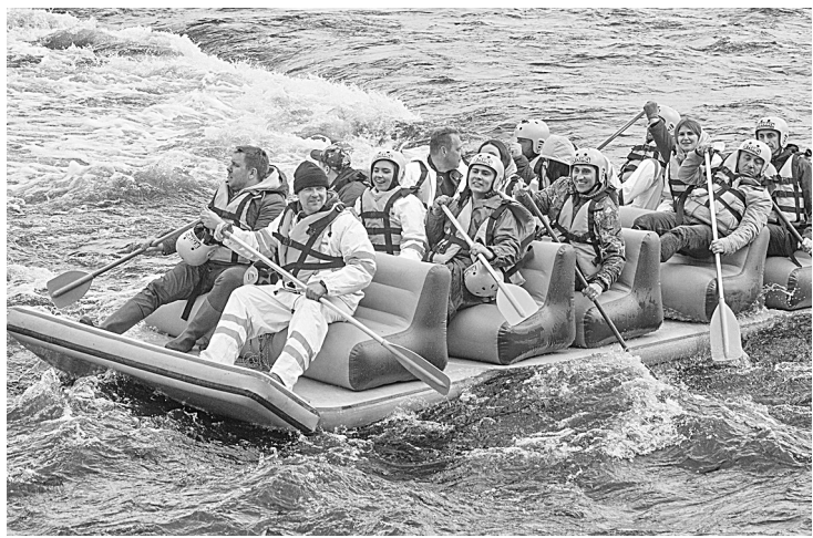
На пороги вышел «диванный флот»